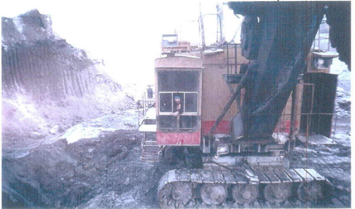
Рабочее место экскаваторщика.