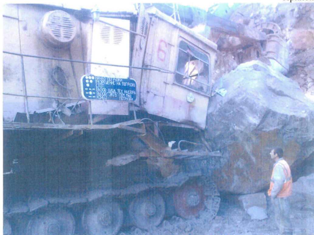
Разрез «Камышенский». Горняцкие будни.