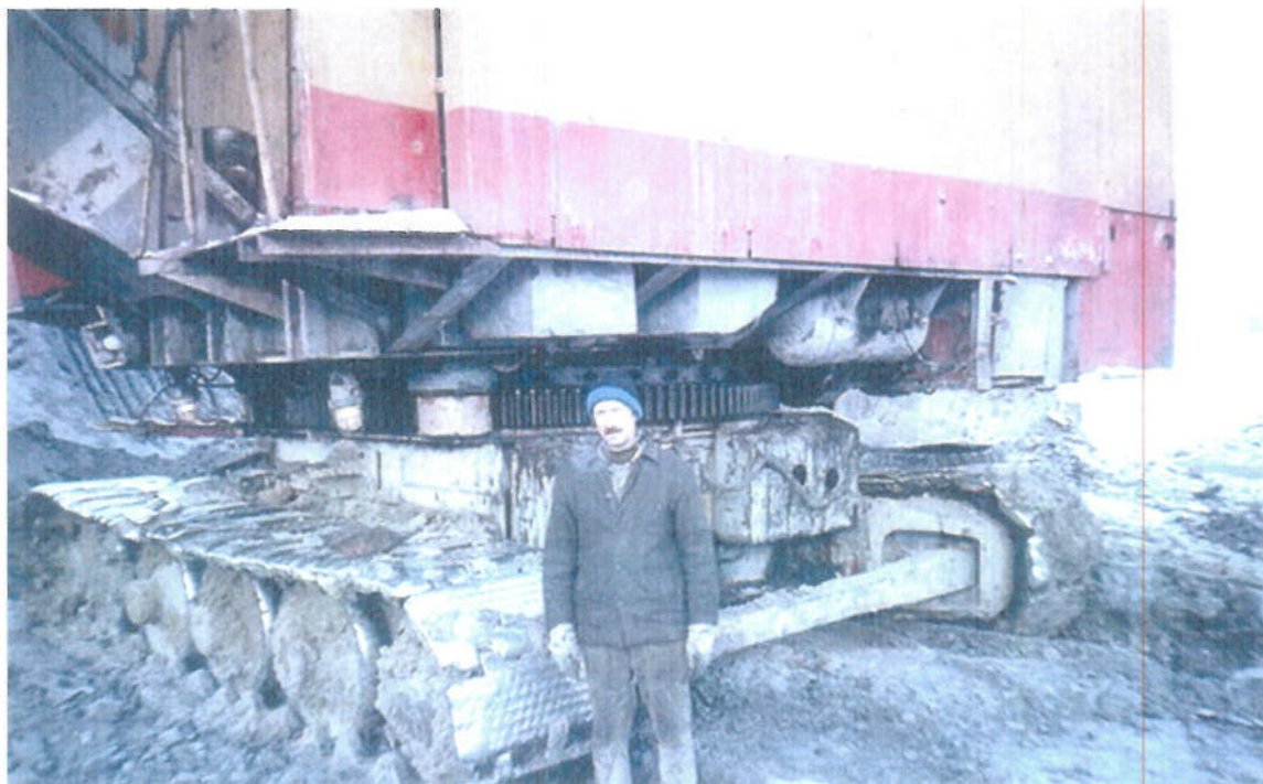
Рабочие будни горняков