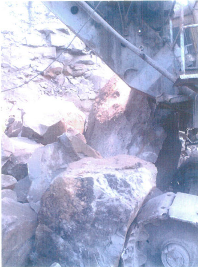
Техника в работе