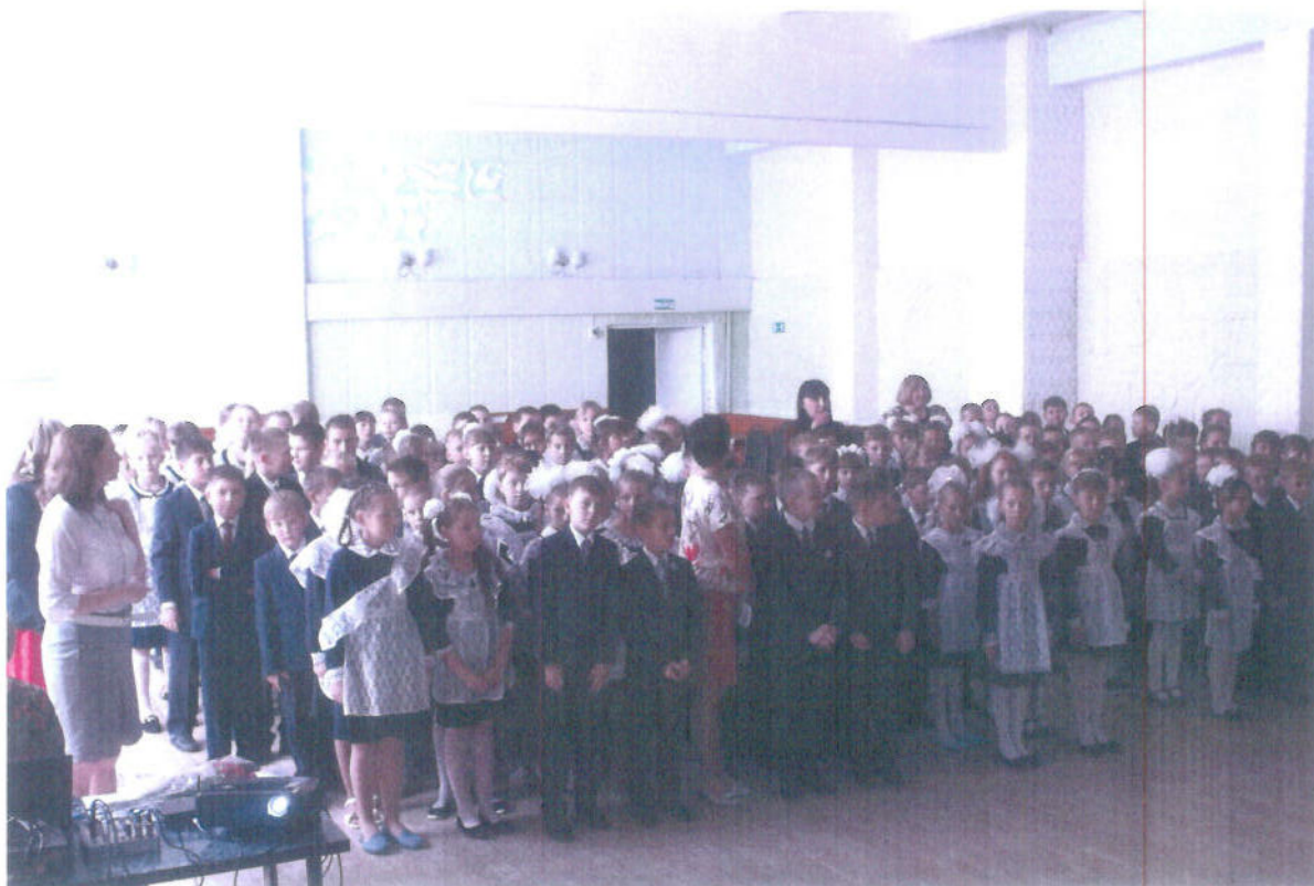
Учащиеся среднего звена