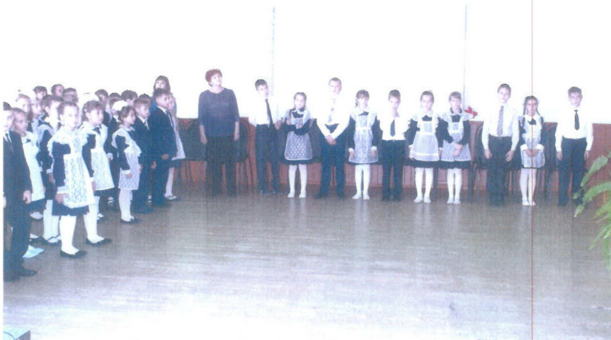
Учащиеся начальной школы