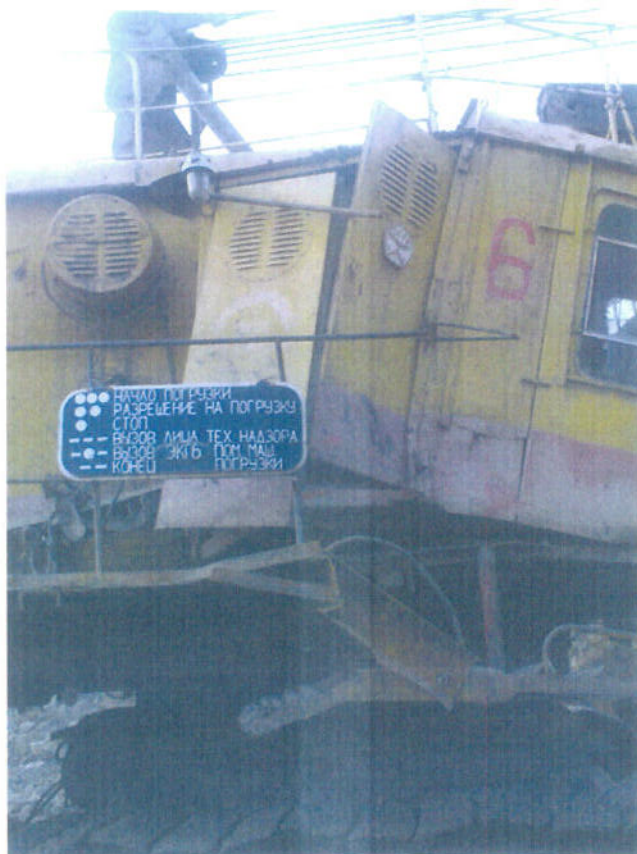
Безопасность на рабочем месте – гарантия безаварийной работы.