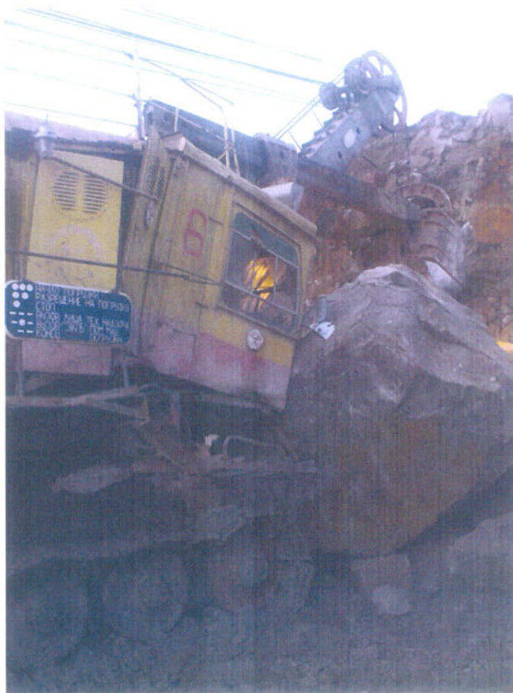
Рабочие моменты на разрезе